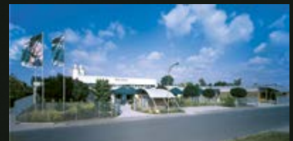
Silikal, Produktion und Verwaltung in Mainhausen/Frankfurt am Main.

Sprechen Sie mit uns. Wir informieren Sie gerne – kostenlos und für Sie unverbindlich.