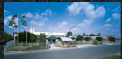
Silikal, Produktion und Verwaltung in Mainhausen/Frankfurt am Main.

Sprechen Sie mit uns. Wir informieren Sie gerne – kostenlos und für Sie unverbindlich.